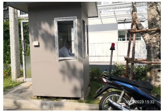
รูปที่ 2-13 การรักษาความปลอดภัยในพื้นที่โครงการตลอด 24 ชั่วโมง