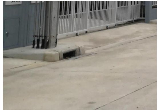
รูปที่ 2-18 ตะแกรงดักขยะ