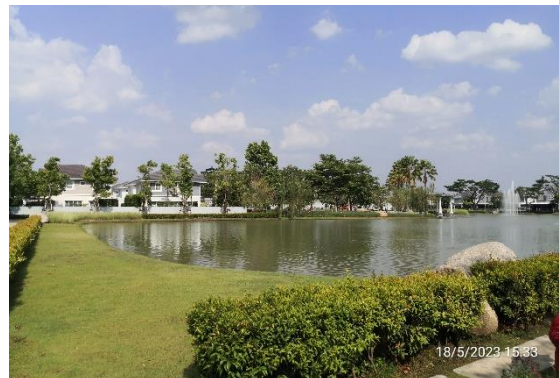
รูปที่ 2-17 บ่อหนองน้ำ