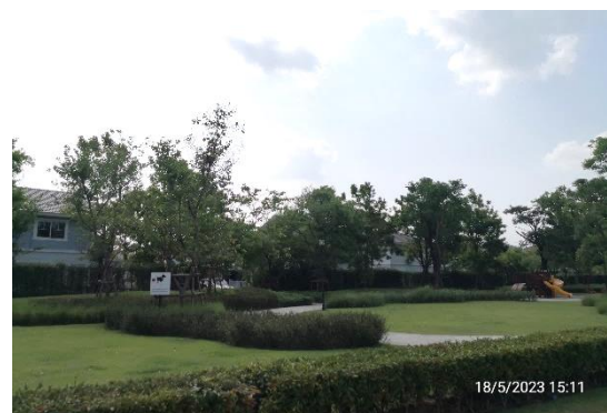
รูปที่ 2-5 พื้นที่สวนหย่อม เก้าะกลางถนนโครงการ และการปลูกหญ้าคลุมดิน