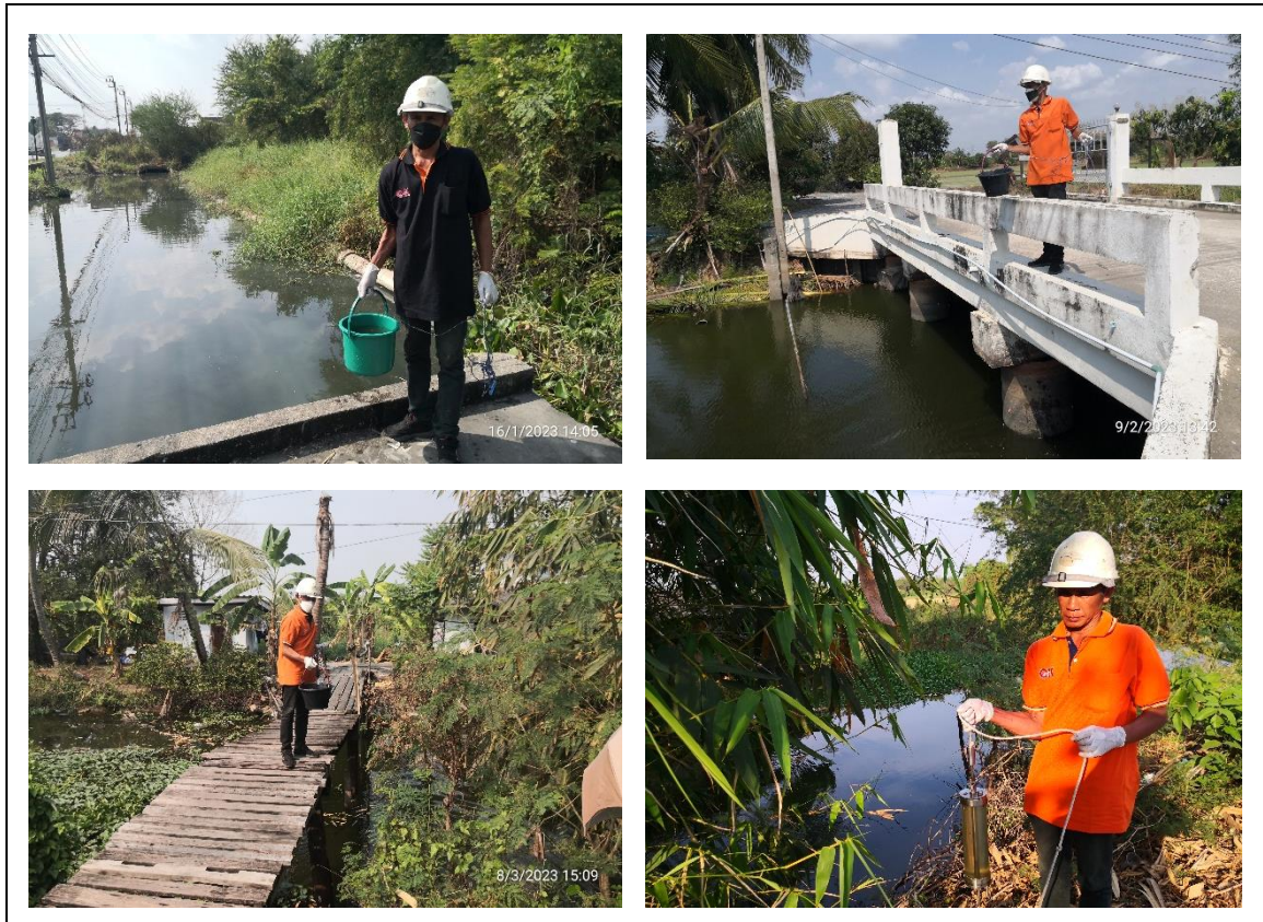
รูปที่ 2-19 เก็บน้ำบริเวณคลองสาธารณะ