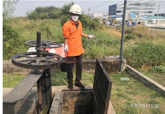
รูปที่ 2-21 ตรวจสอบน้ำในระบบบำบัดน้ำเสียรวม