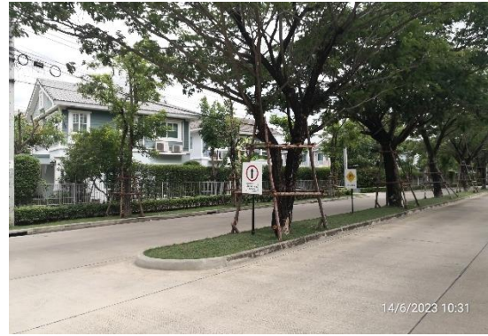
รูปที่ 2-8 ป้ายสัญญาณจราจรประเภทต่างๆ ภายในโครงการ