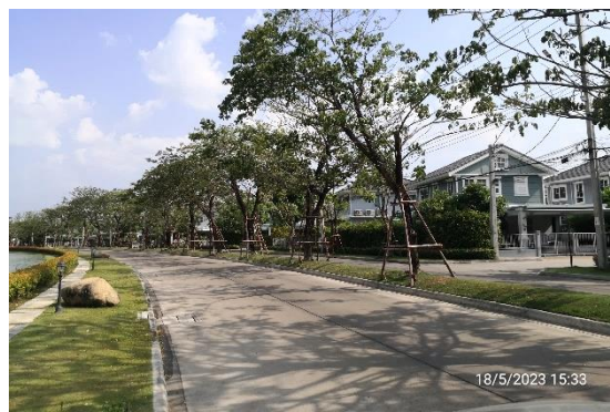
รูปที่ 2-12 การออกแบบก่อสร้างที่เป็นไปตามมาตรฐานและเลือกใช้วัสดุที่เหมาะสม