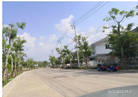
รูปที่ 2-9 ลักษณะถนนภายในโครงการ