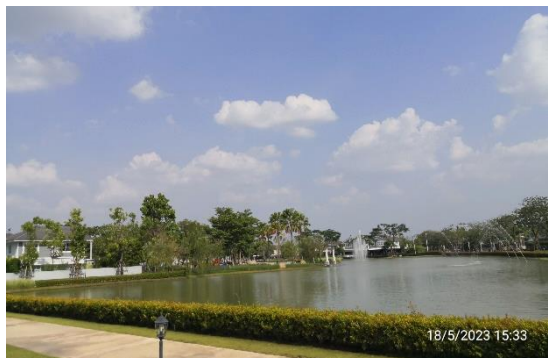
รูปที่ 2-15 ไฟส่องสว่างตามแนวถนนและพื้นที่ส่วนกลาง