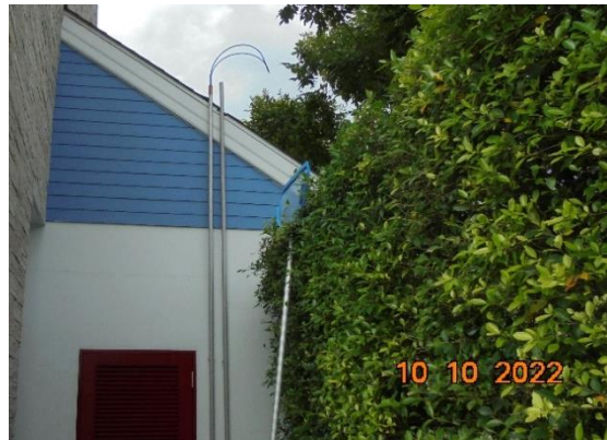
รูปที่ 2-22 ระบบความปลอดภัยของสระว่ายน้ำ