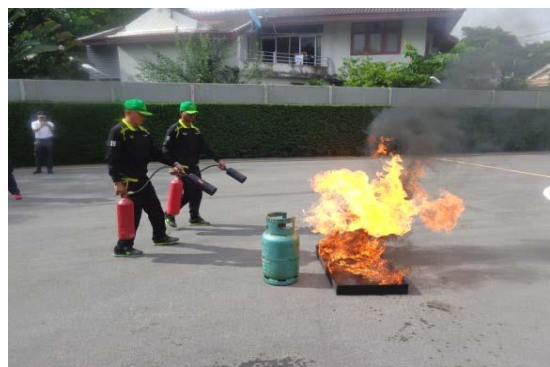
รูปที่ 2-11 การฝึกอบรมพนักงานรักษาความปลอดภัยในเรื่องป้องกันและบรรเทาอัคคีภัยเบื้องต้น