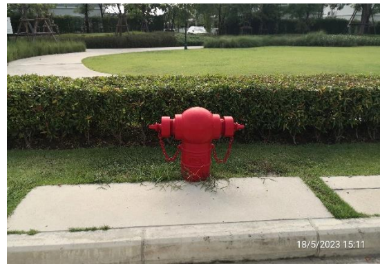
รูปที่ 2-16 หัวดับเพลิง (Fire Hydrant) ที่ได้ติดตั้งในพื้นที่ 1