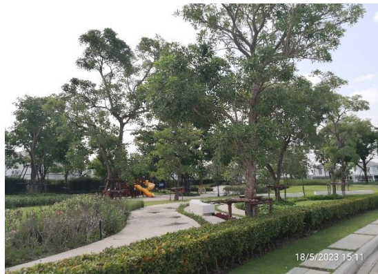
รูปที่ 2-14 การดูแลรักษาความสะอาดสิ่งแวดล้อมภายในโครงการเป็นประจำและสม่ำเสมอ