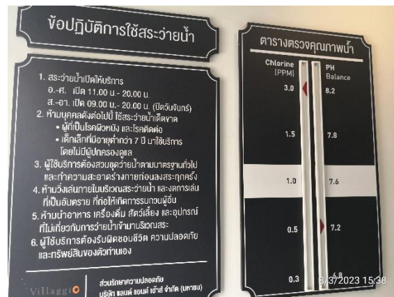
รูปที่ 2-20 ตรวจสอบน้ำในสระว่ายน้ำเป็นประจำ