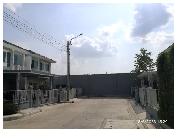
รูปที่ 2-3 รั้วรอบพื้นที่โครงการที่มีส่วนกันขโมย ความสูง 2.8 เมตร