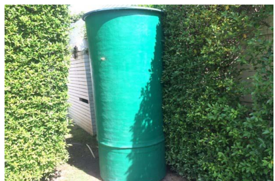
รูปที่ 2-4 ระบบบำบัดน้ำเสียขั้นต้นประจำบ้าน (บน) และระบบบำบัดน้ำเสียรวมส่วนกลาง พื้นที่ที่ 1 และถังดักละออง (ล่าง)