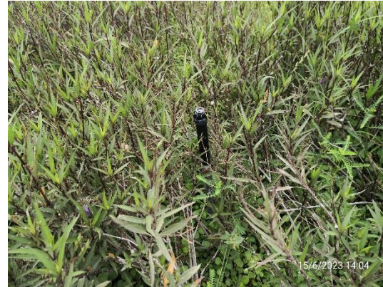
รูปที่ 2-7 ใช้น้ำทิ้งสุดท้ายรดน้ำต้นไม้แบบซึมดิน