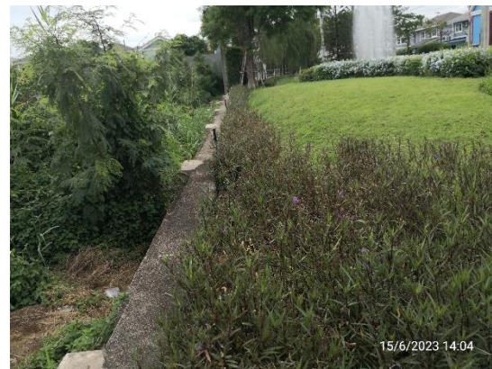
รูปที่ 2-6 การป้องกันการชะล้างพังทลายของดิน โดยจัดทำเป็นกำแพงล้อมโครงการ